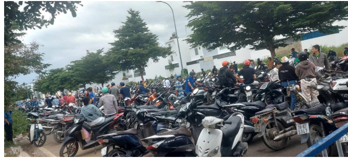
Moto vengono riparate gratuitamente: lo Stato paga!