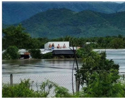
Ponte ciao ciao !!